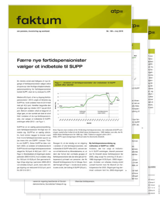
Fakta om SUPP – se faktum nr. 186

stattes de af førtidspensionister på den nye ordning. Ser man alene på udviklingen i tilmeldingsraten for førtidspensionisterne på den nye ordning fra 2009 til 2017, så faldt raten fra 62,7 pct. i 2009 til 53,6 pct. i 2017.