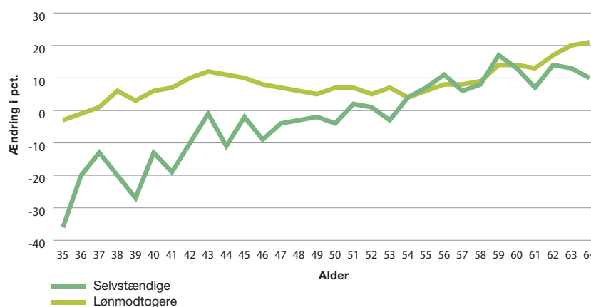
Figur 1 – Ændringen i den gennemsnitlige samlede formue fra 2000 til 2016 opdelt på lønmodtagere og selvstændige i procent

Note: Figuren viser den reale stigning i gennemsnitsformuen fra 2000 til 2016 for aldersgruppen 35-64 år.