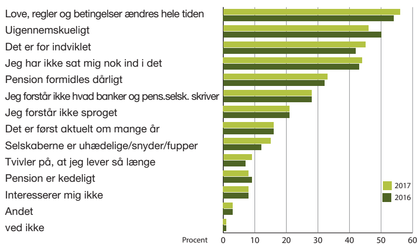
Figur 1. Årsager til, at pension er uoverskueligt

Note: Andel af de adspurgte, som svarer på den primære årsag til, at de opfatter pension som uoverskuelig.